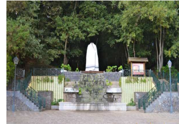
Aula Esperanza, Ortszentrum

Der kleine Lorbeerwald „Bosque del Adelantado“ liegt im Zentrum des Dorfes hinter der „Plaza del Ayuntamiento“. Darin gibt es Wanderwege, auf denen seine Besucher inmitten der Altstadt die Umgebung von Laubwald erleben können. Dieser Wald ist Teil einer Schlucht und wurde früher von Einwohnern für die Versorgung mit Brennholz benutzt. Heute dient er zur Verbindung zwischen den höheren und niedrigeren Teilen des Ortes. Am Eingang des Waldes steht eine alte Weinpresse.